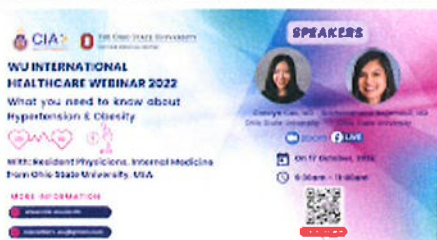
WU Health webinar 2022 Banner (1).png 587K